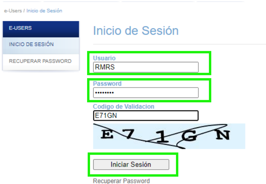
Imagen 2 Pantalla inicio de sesión

2. Ingresamos nuestras credenciales actuales (usuario y contraseña) y el código de verificación.