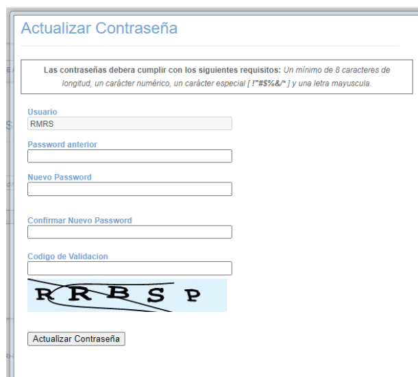
Imagen 3 Pantalla Actualiza Contraseña

3. Cuando la contraseña está expirada debido a que no se han tenido sesiones activas en los últimos 60 días, el sistema desplegará la Imagen 3 y será necesario ingresar nuestra contraseña actual y definir una nueva conforme a los requisitos descritos.